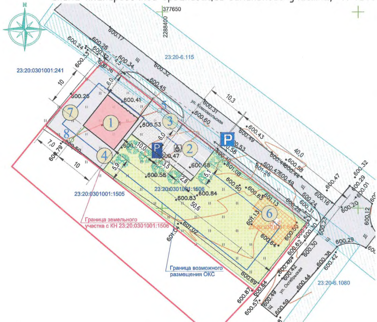
Схема планировочной организации земельного участка, М 1:500